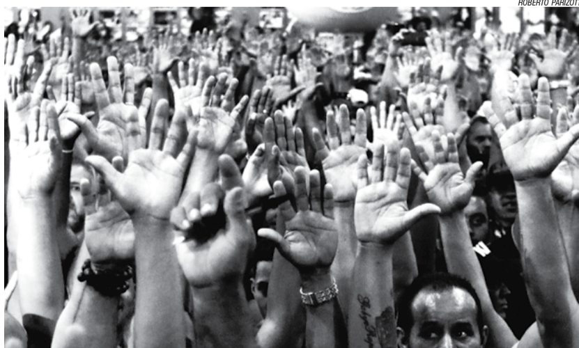
CONDUTORES TAMBÉM APROVARAM PARALISAÇÃO CONTRA A REFORMA, EM ASSEMBLEIA REALIZADA NO DIA 7

Para pressionar os parlamentares, a CUT lançou em junho do ano passado o site napressao.org.br , que permite contatar os parlamentares por e-mail, mensagens, telefone ou redes sociais.